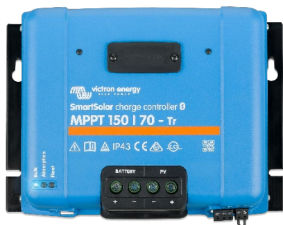
Контроллер заряда SmartSolar MPPT 150/70-Tr без дополнительного дисплея