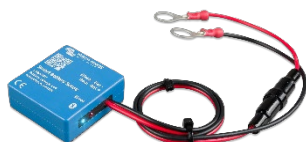
Bluetooth считывание: Smart Battery Sense