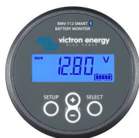
Bluetooth считывание: BMV-712 Smart Battery Monitor