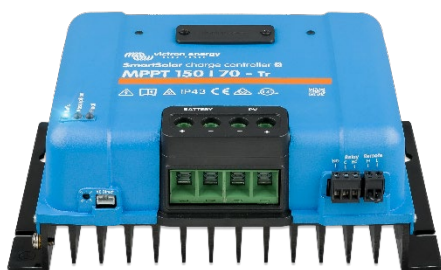
Контроллер заряда SmartSolar MPPT 150/70-Tr без экрана