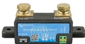
Датчик Bluetooth: SmartShunt