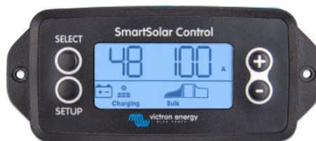
SmartSolar pluggable display

Просто снимите резиновую заглушку, которая закрывает разъем спереди контроллера и вставьте кабель монитора.